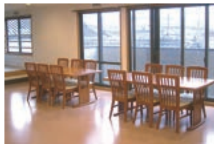
食堂 (既存施設/グループホームやまびこ)